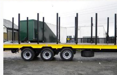
Dim. : 11m60 x 2m54, Tridem, Freinage mixte 25Km/h, Suiv. arr, RC 445/65 R22.5 + RS, Ranchers lat., Grille avant...

Sarl BCM - D910 La Normandie - 37110 VILLEDOMER - 02.47.550.100 - www.remorques-bcm.com