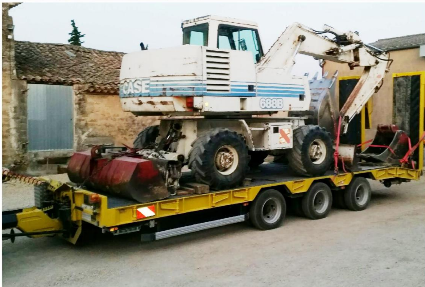
Exemples de chargement