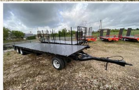
Surface utile : 9m00 x 2m54, Tourelle, RJ 215/75 R17.5, Echelle av/arr avec rallonge, Rampes Aluminium...