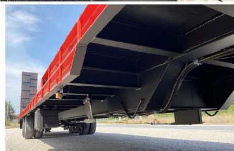
Surface utile : 11m70 x 2m54, Tourelle, RC 235/75 R17.5 Jum., Carré 20 sur plateforme, Cale-Roue...