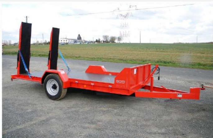
Surface utile : 4m00 x 2m04, Essieu fixe, RC 215/75 R17.5, Fermeture grille avant, Ridelles avant