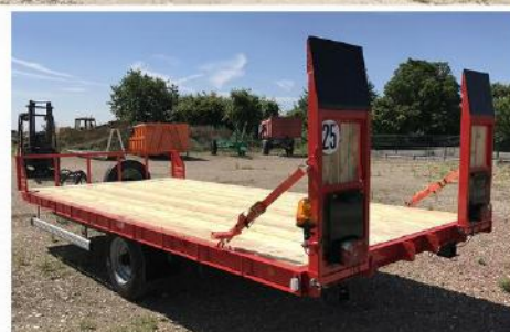
Dim. : 5m50 x 2m54, RC 235/75 R17.5 + RS, Plateau Basculant, Anneau tournant, Plate-forme Bois Intégrale...