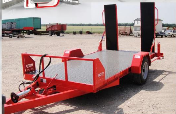
Surface utile : 4m00 x 2m04, Essieu fixe, RC 215/75 R17.5, poignées sur rampes

PORTE-ENGINES 3T PIC PORTE-ENGINES 6T PIC PORTE-ENGINES 7T PIC