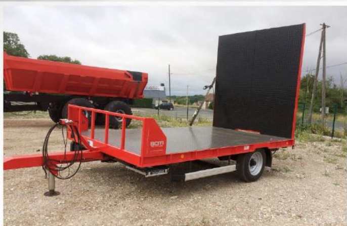
Surface utile : 4m00 x 2m40, Plancher plat, Essieu fixe, RC 215/75 R17.5, Rampe sur largeur totale