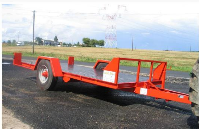
Surface utile : 4m00 x 2m04, Plateau basculant hydraulique, Essieu fixe, RC 215/75 R17.5