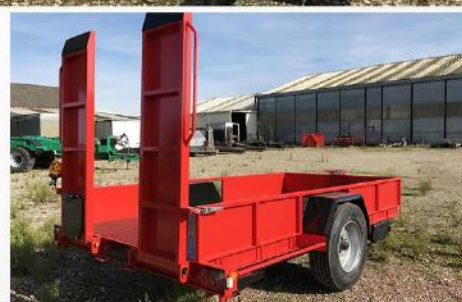
Dim. : 4m00 x 2m04, RC 285/70 R19.5, Ridelles fixes, Plancher rampes Métal déployé, Feux incorporés traverses arr...

Sarl BCM - D910 La Normandie - 37110 VILLEDOMER - 02.47.550.100 - www.remorques-bcm.com