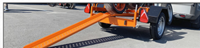
Rampe de chargement, longueur 1m56 Hauteur de chargement : 0m38