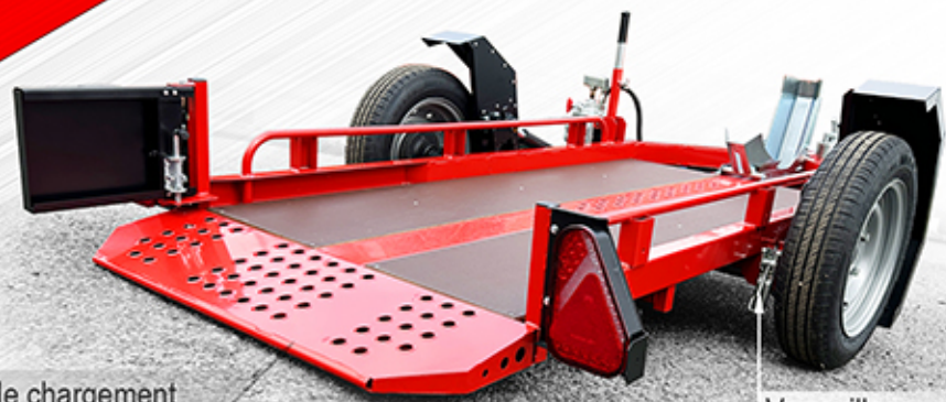
Becquet de chargement De série sur la version abaissable