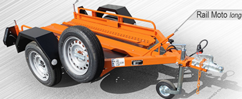
Rail Moto longueur 2m10