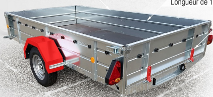
Largeur de 1.22 à 1.53m